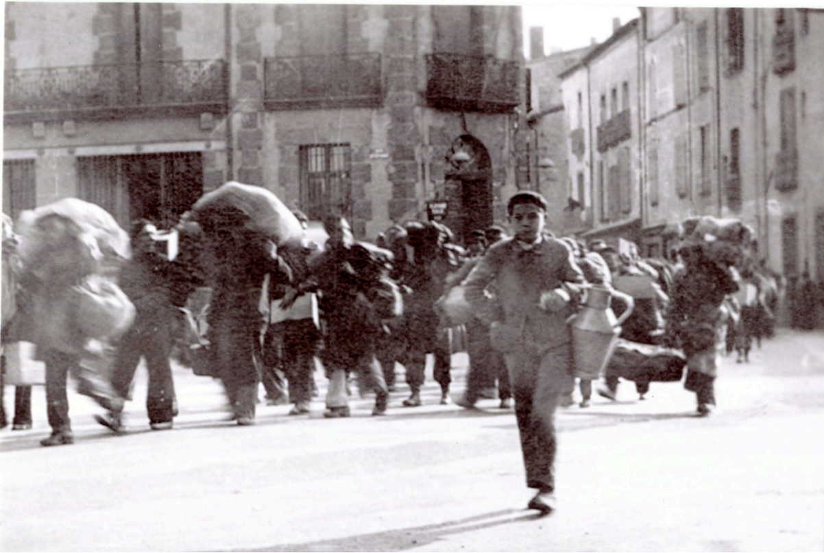
Figure 4. - L'arrivée des combattants républicains espagnols, collection G. Cléophas.

Le général Ménard décide, le 28 février 1939, de créer un centre d'hébergement, à proximité de la caserne Mirabel, afin de décongestionner les camps d'Argelès et de Saint Cyprien. Les Agathois ont connaissance de la nouvelle le 4 mars: L'AVENIR AGATHOIS annonce, en première page, l'installation sur la commune d'un «camp de concentration» destiné à accueillir les républicains espagnols après la chute de la Catalogne. Sa construction débute aussitôt sur le champ de manœuvre qui, est un terrain militaire, situé sur la route de Sète, à côté de la caserne des gardes mobiles. Cependant, sa superficie (18 hectares) est insuffisante pour accueillir 20 000 espagnols. La mairie est ainsi contrainte de réquisitionner des terrains et des bâtiments adjacents, ce qui porte la superficie totale du camp, à 30 hectares. L'indemnisation de ces réquisitions contraint parfois les propriétaires, à des recours auprès de l'administration [7] .