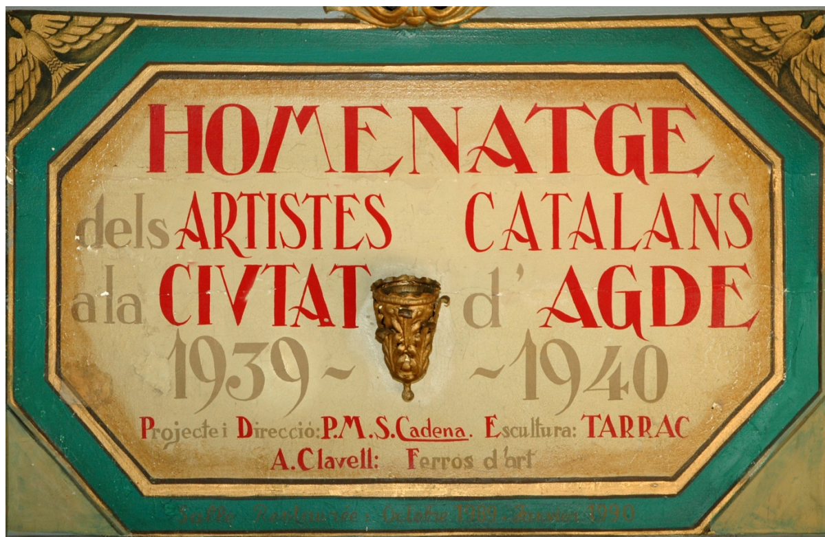
Figure 11- Signature du travail réalisé en 1939 par les artistes catalans du camp d'Agde dans l'ancienne mairie aujourd'hui Maison du Cœur de Ville-.