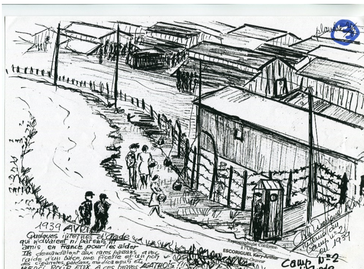
Figure 6 - Dessin d'Arthur Kéry Escoriguel, catalan interné au camp d'Agde, Archives municipales d'Agde 38 Z 10.

Dans les articles des semaines suivantes, l'inquiétude se mêle à la pitié. De plus, certains Agathois se rendent aux abords du camp pour échanger quelques mots ou donner de la nourriture aux internés du camp. La scène est décrite par un dessin d'Arthur Kéry Escoriguel [20] .