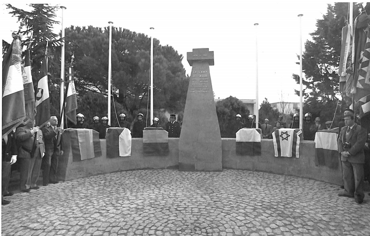
Figure 12- Monument du camp d'Agde inauguré en février 1989 lors des cérémonies du Cinquantenaire. Il est situé près du collège René Cassin, à l'emplacement de l'entrée du camp.