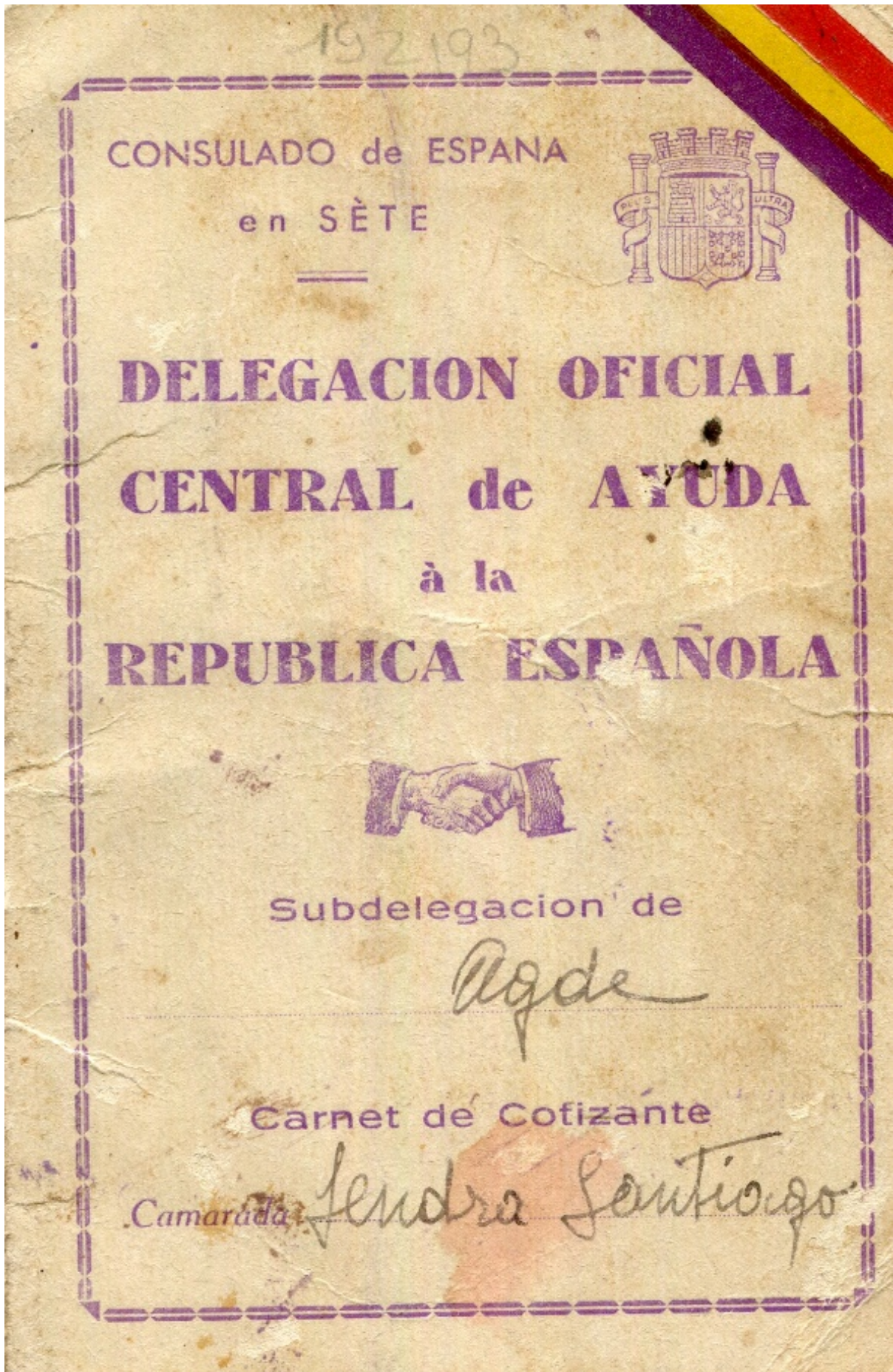
Figure 1 Carnet de cotisations pour les collectes organisées par l'antenne agathoise du